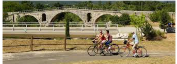
Le pont Julien