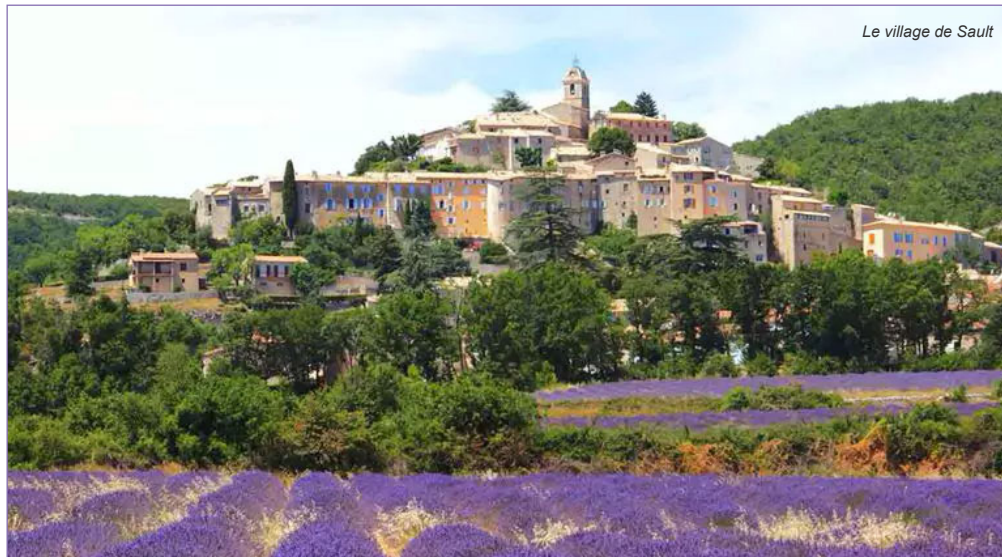
Le village de Sault