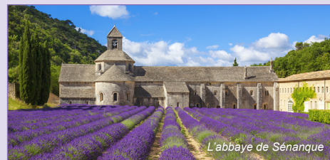
L'abbaye de Sénanque

L'abbaye de Sénanque enserrée depuis le 12 ème siècle dans le creux de son vallon provençal, l'Abbaye Notre-Dame de Sénanque apparaît comme l'un des plus purs témoignages de l'architecture cistercienne primitive. Nous marchons dans les pas des Frères et maintenant cette tradition monastique quasi millénaire à Sénanque en vivant à l'Abbaye selon la Règle de Saint Benoît.