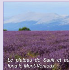
Le plateau de Sault et au fond le Mont-Ventoux

Découvrez le travail des lavandiculteurs en 4 saisons. Elle est cultivée sur le plateau de Sault en Provence à 800m d'altitude, idéal pour obtenir une production de qualité.