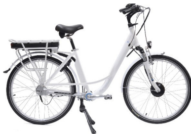
Le panier amovible pour les blancs