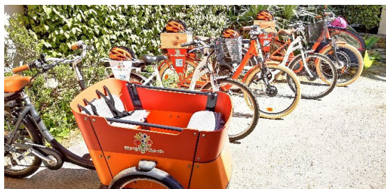
Parc des VAE mis à disposition

J'avais le choix mais Mireille m'a conseillé le modèle Orange plus robuste pour un homme, les blancs conviennent mieux à la gente féminine.