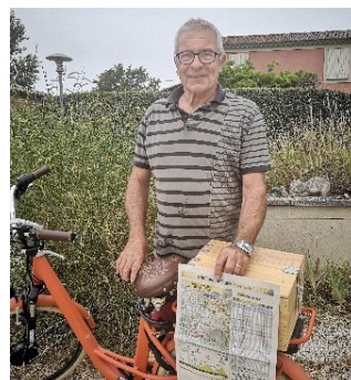
La caisse en bois avec cadenas pour les VAE Orange

Le trajet TAILLADES Haut de LAGNES 40 minutes en prenant son temps, car les paysages sont différents quand on devient cycliste. J'arrête de parler et je vous fais découvrir l'épreuve mondiale connue.