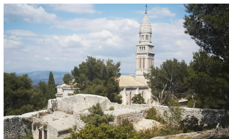
Notre Dame de Beauregard

montez à Notre Dame de Beauregard. Vous y découvrirez un panorama exceptionnel, vous aurez une vue plongeante sur la vallée heureuse, son lac et enfin un lieu pour pique-niquer tout en le respectant. S'il vous reste du temps un détour par Eygalieres pour y voir la chapelle Saint-Sixte. Un détour chez la biscuiterie Charly à Saint-Andiol est un dépaysement pour la vue et les papilles.