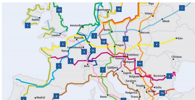
Schéma national des vélos routes au 1er janvier 2021 25 587 Km inscrits 58 Km inscrits, dont 10 itinéraires Eurovélos 18848 Km ouverts (74%), dont 45 % en site propre 1241 Km ouverts en 2020 dont 31 % en site propre 6739 Km d'itinéraires nationaux à réaliser pour 2030

Eurovélo est le réseau des Véloroutes européennes. Porté par la fédération européenne des cyclistes (ECF), le projet eurovélo comporte 17 itinéraires cyclables européens répartis sur tout le continent. Les 17 itinéraires eurovélo représentent 91500 Km (en tenant compte des portions d'itinéraires dupliqués ou liaisons), dont 45000 Km sont déjà développés et traversent 42 pays. La France est concernée par 10 Euro Vélo, soit 8806 Km, réalisés à 92,5 % au premier Janvier 2021.