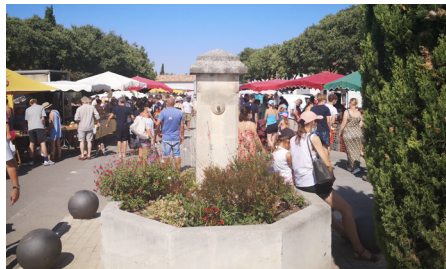
Le centre du marché des producteurs

Accès facile au départ des gîtes de Bel-Air.