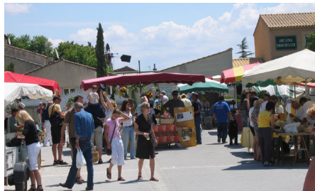
Le centre du marché des producteurs