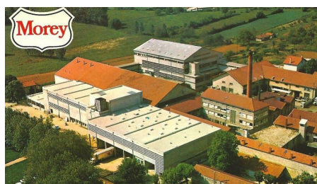
L'usine de Cuiseaux

La Boucherie charcuterie, salaison arbore la marque MOREY qui a existé du temps de mon grand-père. Certes les plus vieux s'en rappellent. Je m'arrête là car je suis en train de vous raconter cette fameuse histoire développée dans l'Edito. Je me bornerai à vous parler de la marque MOREY .