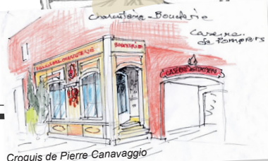
Croquis de Pierre Canavaggio