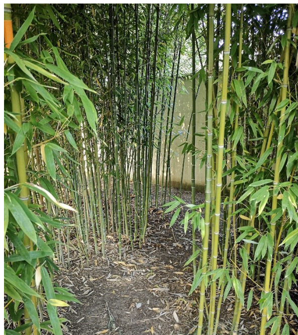
Entrée de la forêt de bambou

C'est un petit labyrinthe de 120 m 2 dédié aux enfants de 5 ans et moins accompagnés par leurs parents pour la mise en place des sujets sur des supports fixes. 5 thèmes de 5 sujets sont proposés. Il seront mis en situation par les parents à travers le cheminement, les enfants devront les chercher et les ramener au point de départ. C'est un grand-père et sa petite-fille qui sont la base de cette création. Ce lieu est réservé exclusivement aux occupants du gîte jaune. Cette forêt de Bambou est aussi un lieu de lecture pour les plus grand avec à proximité une terrasse en bois avec pergola bois et fontaine.