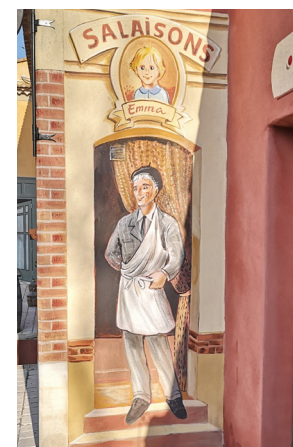
L'entrée de la boucherie & MOREY