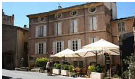
Place du village

(Ouverte uniquement en été et à Noël pour la crèche). Cette église du XIIIe siècle domine, du haut de ses 425 mètres, le village de Bonnieux. Mélange de gothique et de roman, elle est classée Monument historique depuis 1980. Elle est composée d'une partie romane et de deux chapelles latérales ajoutées plus tardivement.