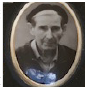
Moulin de Jérusalem

L e dessin terminé du boucher m'a troublé, et voici pourquoi. Cet air de ressemblance avec mon grand-père qui été aussi mon parrain, m'a donné la passion du dessin et l'amour pour l'eau. Ancien meunier à la minoterie Chevalier à Sorgues, il me disait, « Petit ! Si tu fais un métier où la présence de l'eau est indispensable tu auras toujours à manger. »