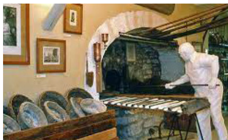
Musée de la boulangerie

Implanté autour d'un ancien four à pain, il perpétue la mémoire d'une histoire interculturelle, vieille de plus de 8 000 ans : celle du pain. Une invitation à découvrir l'univers de la «boulange», du champ de blé à la tartine.