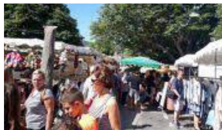
Le marché de Bonnieux