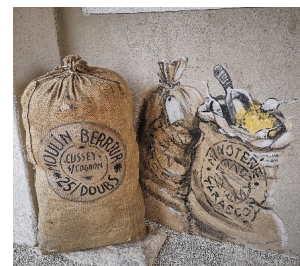
Les trois sacs de blé avec les souris