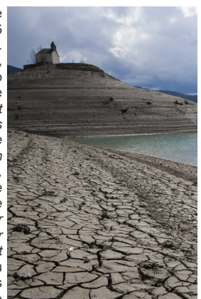
Le lac de Serre-Ponçon