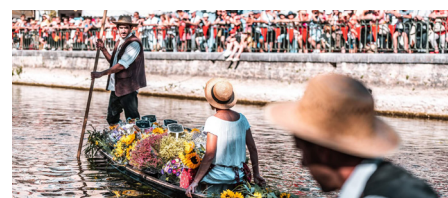
Le marché flottant

Rendez-vous le dimanche 4 septembre 2022.