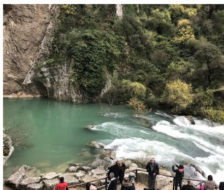
Le gouffre de Fontaine de Vaucluse

Avec un écoulement total moyen de 630 millions de m 3 par an, cette source est la première de France et l'une des plus importantes au monde, par son volume d'eau écoulé. Fraîche et paisible en été, bouillonnante et impétueuse au printemps et en automne, la source, véritable caprice de la nature, ne cesse d'intriguer curieux et chercheurs depuis l'Antiquité. La source résulte de l'émergence d'un immense réseau souterrain. Les eaux qui bondissent à Fontaine-de-Vaucluse proviennent de l'infiltration des eaux de pluie et de la fonte des neiges du sud du Mont Ventoux, des Monts de Vaucluse et de la Montagne de Lure qui représentent un « impluvium » de 1 240 km 2 et dont l'unique issue demeure Fontaine-de-Vaucluse.