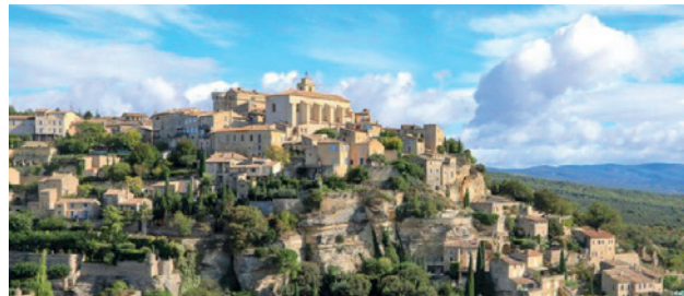
Village de Gordes

Aux confins du Parc Naturel Régional du Luberon, au cœur des monts de Vaucluse, Gordes est l'emblème du village perché provençal.