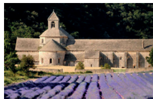
L'Abbaye Notre-Dame de Sénanque

Au cœur d'une vallée proche de Gordes, se trouve l'Abbaye cistercienne Notre-Dame de Sénanque . Entourée de lavandes, elle est l'un des monuments les plus connus de Provence et du Parc Naturel Régional du Luberon. Ce monastère, avec son histoire riche et son architecture exceptionnelle, est toujours en activité. Des moines y vivent et entretiennent les lieux ouverts aux visiteurs. C'est également au XII e siècle que fut édifié la magnifique abbaye de Sénanque , l'une des trois « sœurs » cisterciennes de Provence avec les abbayes de Thoronet et de Silvacane