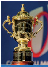
Le trophée WEBB ELLIS

La Coupe William Webb Ellis, appelée aussi Trophée Webb Ellis, est la récompense décernée à l'équipe vainqueur de la Coupe du monde de rugby à XV. Le trophée est baptisé du nom de William Webb Ellis, qui serait selon la légende l'inventeur du rugby.