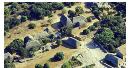
Vue aérienne du village des Bories

Le village des Bories est situé à l'entrée de Gordes. C'est un groupement de cabanes en pierres sèches (les bories) qui servaient d'abris ou d'habitations aux agriculteurs, dès l'âge de bronze. Aujourd'hui accessible à la visite, le site vous plonge dans la vie de nos ancêtres et permet de découvrir les étonnantes techniques d'assemblage de pierres de l'époque.