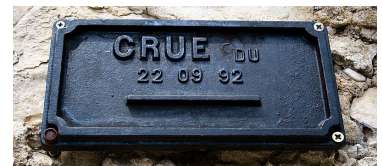
Plaque de crue

Grimpez ensuite les ruelles pavées pour découvrir la vieille ville. Vous y découvrirez de très beaux jardins dans des cours intérieures, des fontaines chantantes et des passages vers la ville basse... Très jolie promenade garantie, à l'écart de la foule. Protégée par ses hauts remparts et sa porte fortifiée, découvrez la vieille ville. Avancez-vous vers la tour du Beffroi, surmontée d'un campanile. Admirez les façades anciennes des habitations bourgeoises et populaires ainsi que les hôtels particuliers.