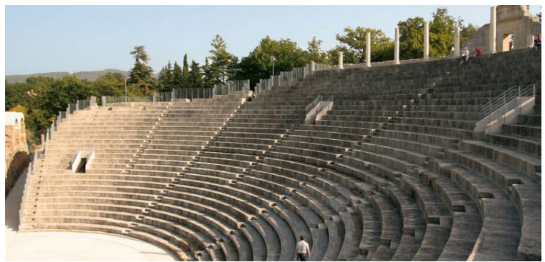
Sites de Puymin & La Villasse