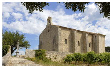
La Chapelle Saint-Quenin

La Chapelle Saint-Quenin est unique en France. Très bel exemple d'art roman provençal, elle présente un chevet triangulaire avec un décor à l'antique tout à fait remarquable.