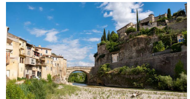
Le pont romain et la cité médiévale à gauche

déployant une architecture unique, et son arc large de 17m d'ouverture. Trait d'union entre la cité médiévale et la ville basse, il est le symbole même du génie architectural romain.